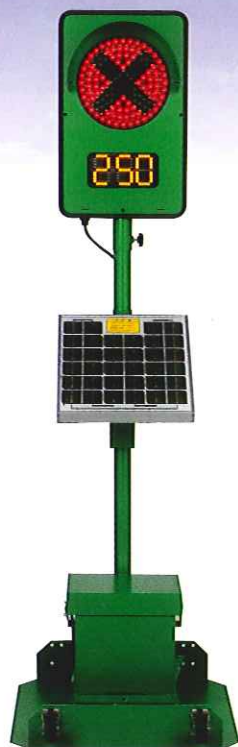
1灯式 CGS-1250S-K 可搬型立脚台仕様