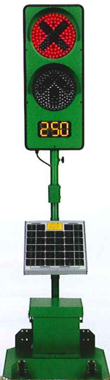
2灯式 CGS-2250S-K 可搬型立脚台仕様